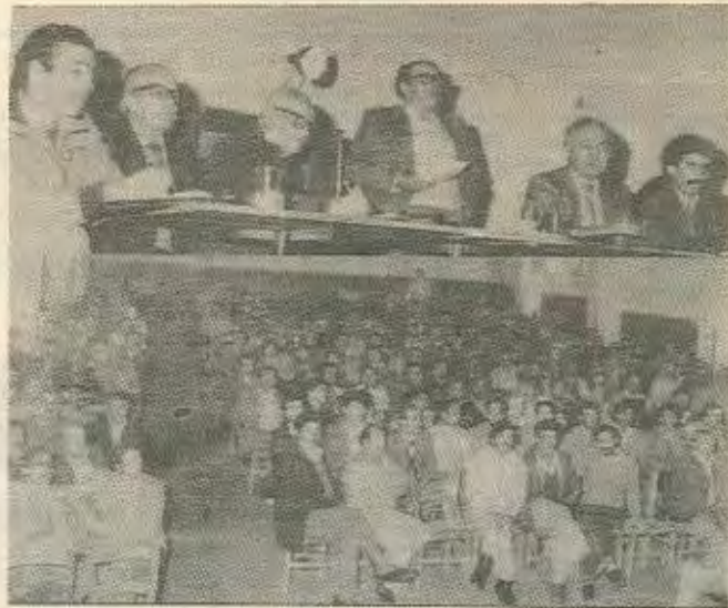
Γενική συνέλευση των Αμιαντορυχών

Η αγορά του Αμιαντορυχείου από την Μητρόπολη Λεμεσού, έγινε κατόπιν κυβερνητικής ενθάρρυν-